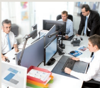
Die zafir Dispatch Specialists