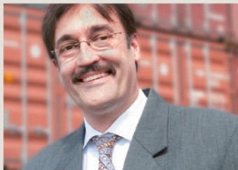
Zollrecht mit zafir

Deutschlands handverlesene Zollanwälte für Ihre Zollsicherheit