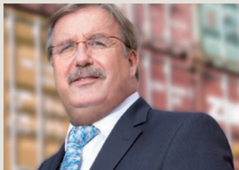
Zollpraxis mit zafir

Ehemalige Zöllner begleiten Sie bei allen wichtigen Zollfragen